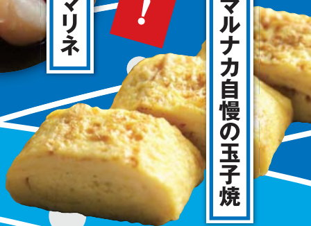
マルナカ自慢の玉子焼