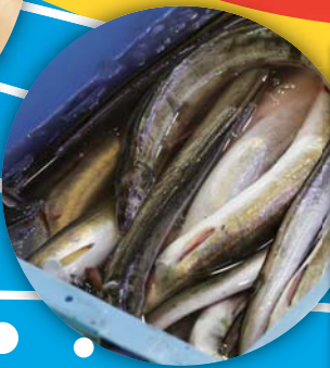
伊勢湾産ハモ湯引き