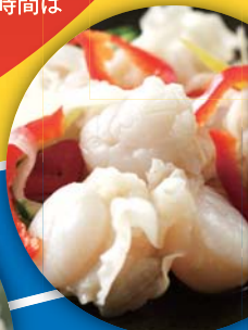
イタヤ貝のマリネ