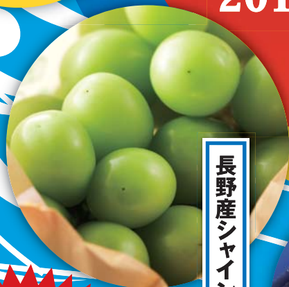
長野産シャインマスカット